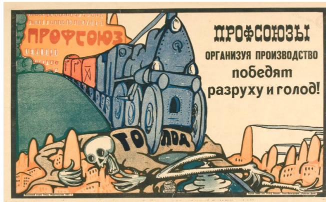
Агитационный плакат 1918 г.

Как же так?! Вроде свергли эксплуататоров, вроде свободу провозгласили, и тут – на тебе, – трудовая повинность. Более того, Ленин сформулировал главный принцип социализма с безжалостной чёткостью: « Кто не работает, тот не ест ». Сурово, но здесь справедливости и правды больше, чем в царских словах о свободном труде , когда условия были нечеловеческие, но зато разрешалось не работать вообще.