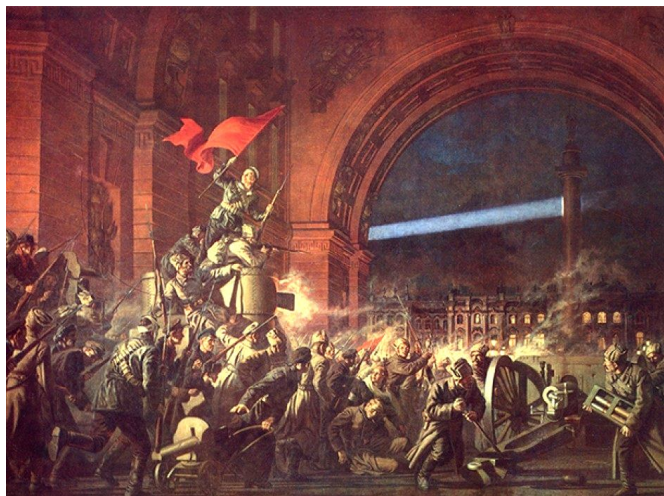
Н.Кочергин «Штурм Зимнего дворца»

В ночь с 25 на 26 октября 1917 г (по ст. ст.) в Петрограде вспыхнуло подготовленное большевиками вооружённое восстание.