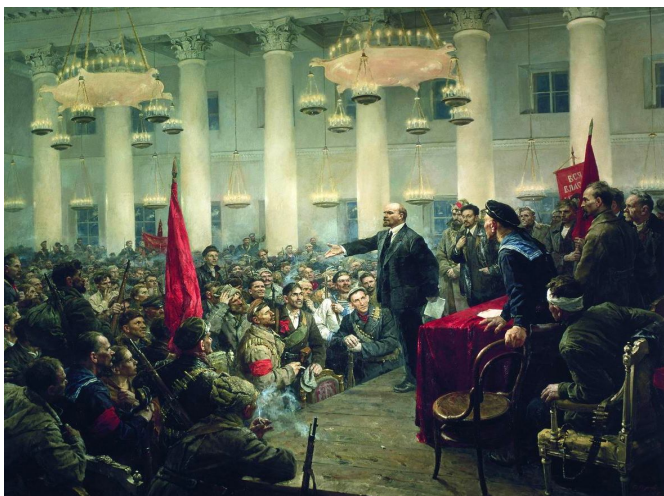
В.Серов «Выступление В.И.Ленина на II Съезде Советов»

Временное правительство было свергнуто, и власть в свои руки взяли Советы рабочих и солдатских депутатов.